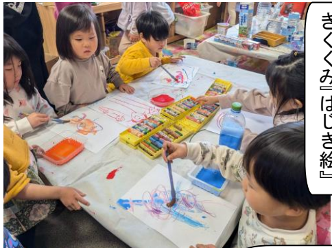
きくぐみ『はじき絵』

童心のつどいのプログラムは、各クラステーマや年齢に応じた技法を用いて作りました。その他にも、立て看板やゆりぐみは衣装も自分たちで作りました。身近にあるリサイクル素材を活用して、思い通りの創意工夫して作る姿が見られました。