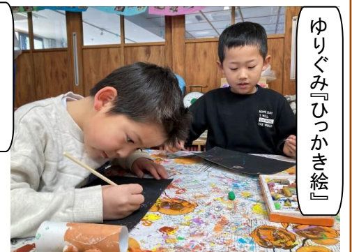
ゆりぐみ『ひっかき絵』